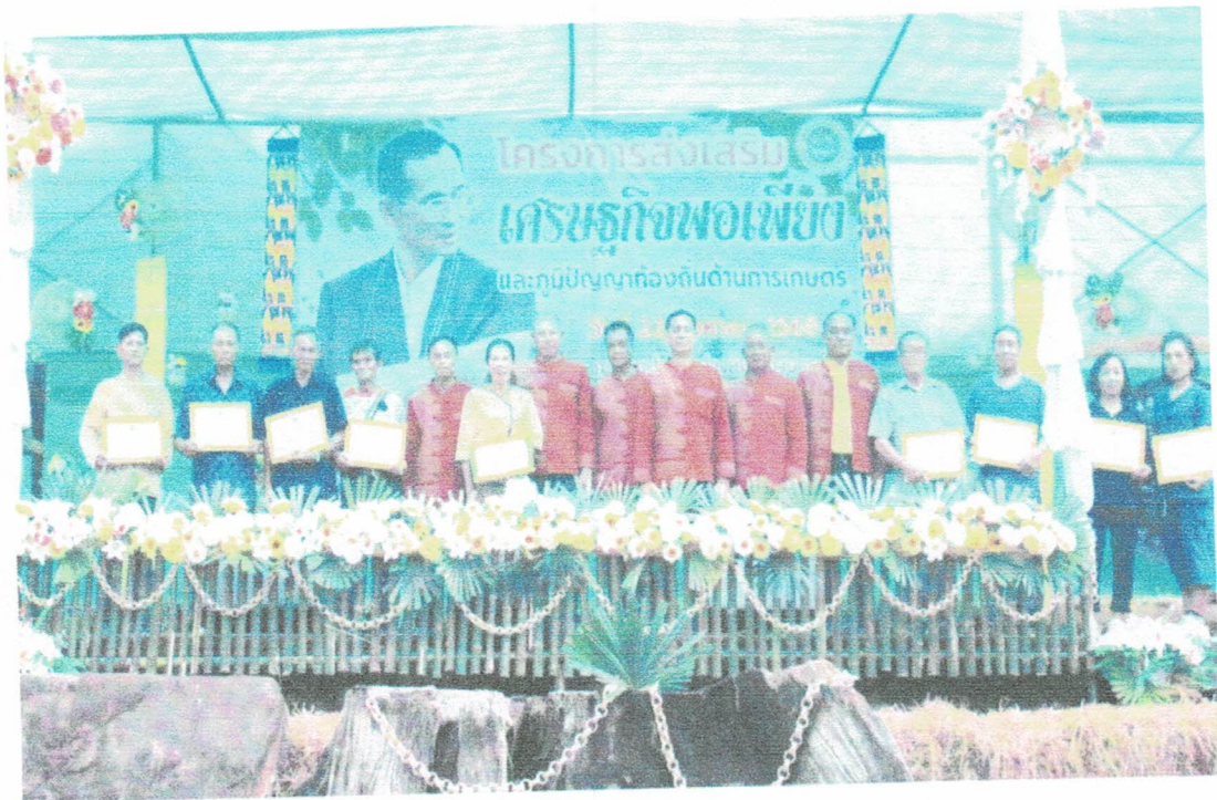
บุคคลภายนอกองค์กร