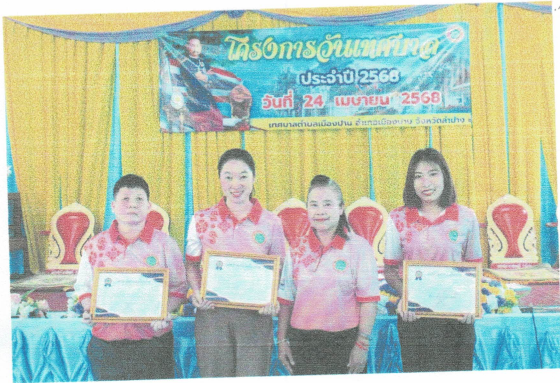
ข้าราชการและพนักงานจ้าง ภายในองค์กร